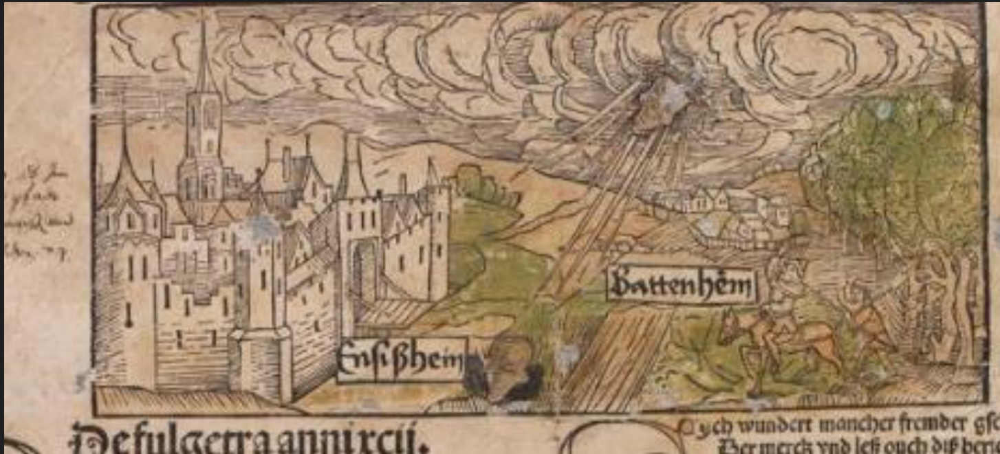
Sebastian Brant, Einblattdruck lat.-dt. (KT 79-80) Der Donnerstein von Ensisheim/Elsass Meteoriteneinschlag 7. Nov. 1492

Akrostichon im deutschen Text: SEBASTIANUS BRAND DOCTOR