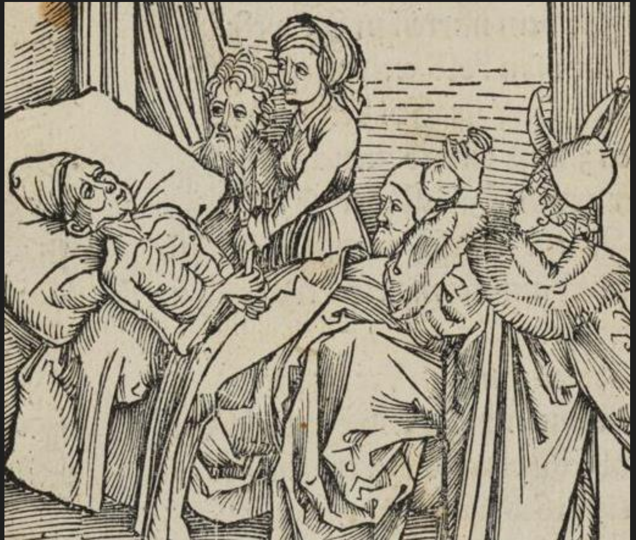
Narrenschiff, cap. 55: Von narrechter artzney

Der gat wol heyne mit andern narn Wer eym dottcranken bsucht den harn Vnd spricht/wart/bis ich dir verkünd Was ich in mynen büchern fynd