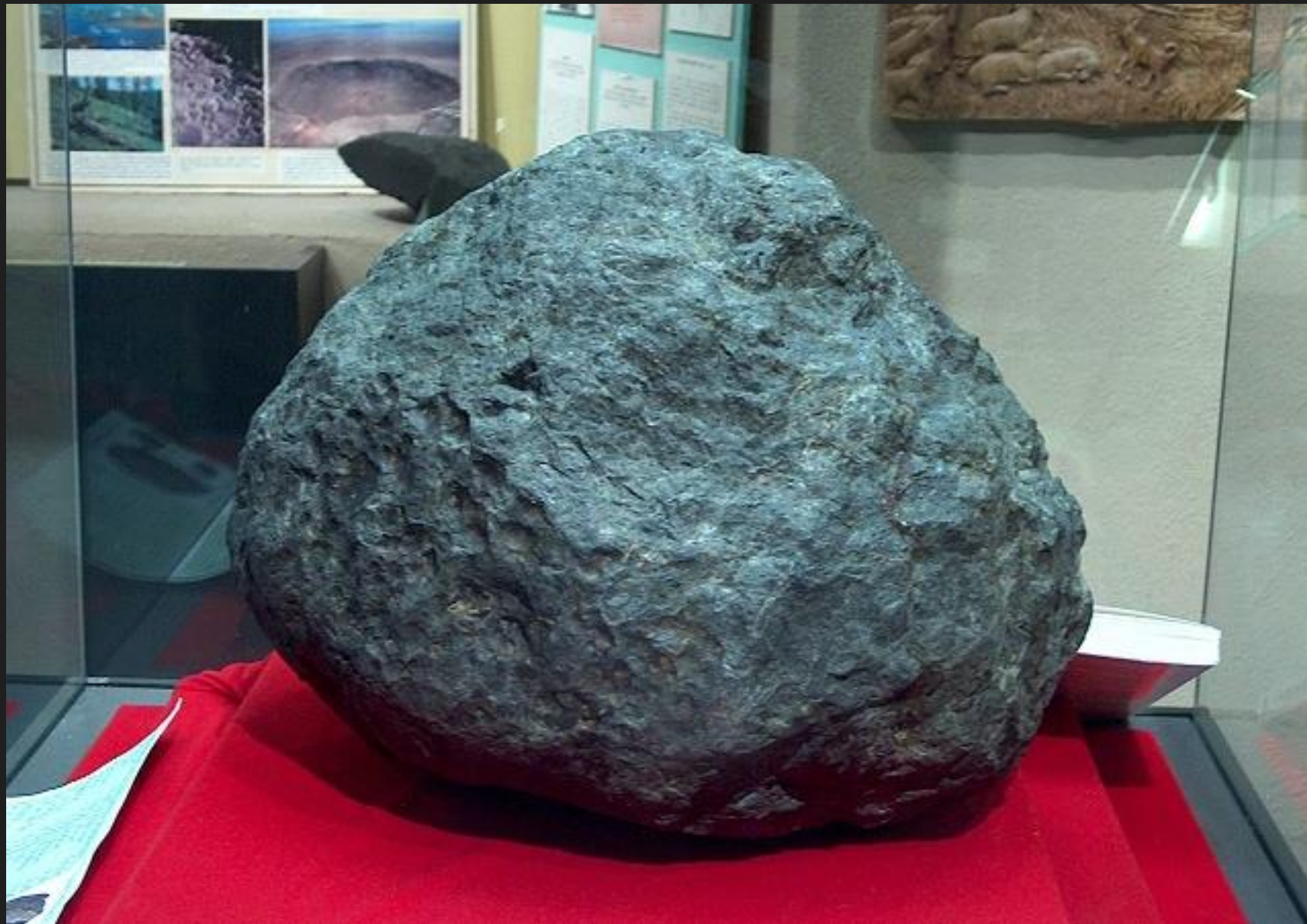
Meteorit von Ensisheim/Elsass, ca. 127kg: heute im Fremdenverkehrsamt