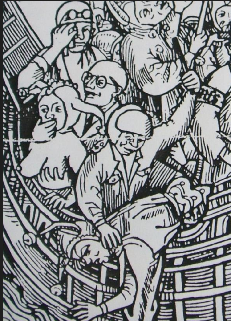
Johannes R. Becher, Kulturminister der DDR, Verfasser der DDR-Nationalhymne